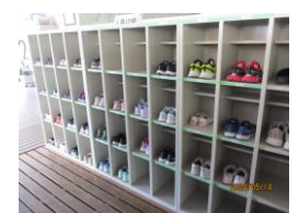
↑ くつを揃える取組