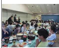
↑ 6 年生修学旅行