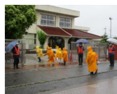
↑ 民生委員様挨拶運動