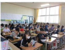
↑ 5 年生読書の様子