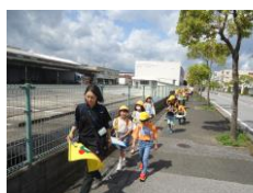
↑ 2 年生町探検