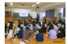
↑ 4 年生総合学習