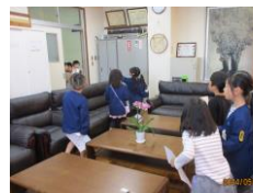
↑ 1 年生学校探検