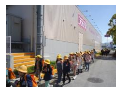
↑ 3 年生校区探検