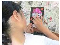
↑チョコレートアーティスト体験