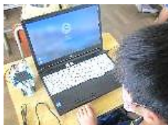
↑プログラミング体験