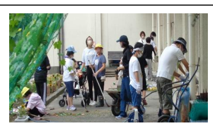
保護者・5、6年生の協力のおかげで、運動場、校舎がとてもきれいになりました。ありがとうございました。

いよいよ2学期が始まりました。子どもたちは、この2か月間でまた一回り成長したようにも見受けられます。2学期は、1年間の中で一番登校回数が多く、一気に伸びる時期でもあります。子どもたちにはさまざまな教育活動を通して、夢を叶えられるように学力を高め、社会性を身につけ、健康・体力の向上を図ってほしいと期待しています。また、いつの時代も子育てに悩みはつきものです。どうぞ、お気軽に学校までご相談ください。保護者や地域の皆様におかれましては、2学期も子どもたちが安全・健康に過ごせますように、見守りやお声かけ等をどうぞよろしくお願い申し上げます。