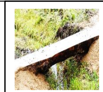
わくわく公園の3本の木製の橋を新しいものに取り換えていただきました。じょうぶな橋になりました。

8/27(土)はPTA奉仕作業でした。今年、8月に入ってからの大雨で運動場に草が広範囲に渡り生えました。当日は約200名の保護者の皆様の参加をいただきました。深くお礼申し上げます。校舎外では運動場の草取りや溝の土砂上げ、体育館周りの除草、わくわく公園の小川の清掃等をしていただきました。また、校舎内では教室や廊下の窓ふき等をしていただきました。ほこりや汚れが取れ美しくなりました。当日参加してくれた子どもたちも便所、廊下等の清掃をしてくれました。お陰で気持ち良く2学期を迎えることができました。皆様には大変お世話になりました。ありがとうございました。