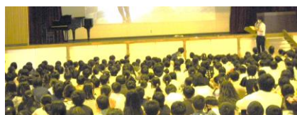
6月の全校朝会一堂に会する

向暑の候 保護者・地域の皆様には平素より本校教育活動推進のため、ご理解とご協力を賜りまして厚くお礼申し上げます。7月を迎え1学期も残すところあと3週間となりました。6月は学習活動も本格的になり、日々の学習活動はもちろん、校外学習も計画通りに実施することができました。子どもたちは学びを深め、成長の姿が見られました。