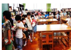
↑本を借りるための行列