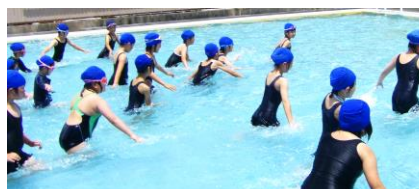
プール水泳はじまる

6/1(月)には、本年度初めて全校が体育館に集っての全校朝会を行いました。1年生にとっては800人以上が一堂に会する場面は初めてでしたが、担任の指導のもとしっかりと参加することができました。1年生から6年生までの全校が集まっても静かに話を聞くことができました。子どもたちの4月からの成長ぶりを感じたところです。