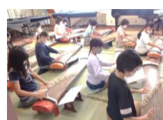
↑クラブ活動(琴クラブ))