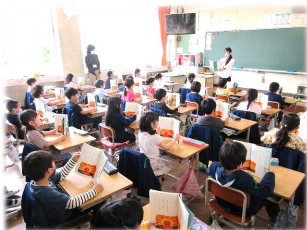
1年生教室・国語科「あさのおひさま」の朗読の様子